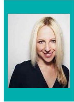
Maja Metzner Design